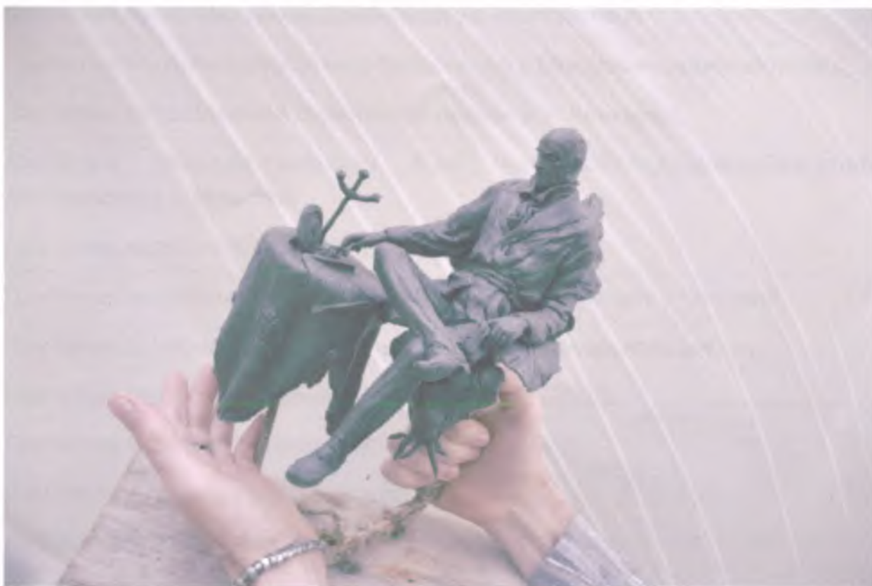
Модель пам'ятника в руках автора

Передбачувана вартість споруди вісімсот тисяч гривень. З них: сімдесят тисяч грн. проектно-вишукувальні роботи. Сто п'ятдесят тисяч грн. спорудження плити (плінта), п'ятсот вісімдесят тис.грн. створення скульптури.